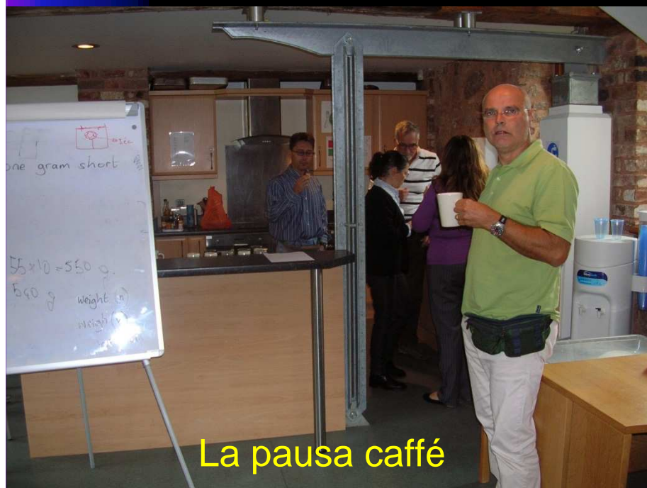
La pausa caffè

Da Lunedì 19 a Venerdì 30 SETTEMBRE 2011